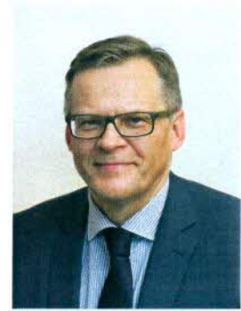
PREZES KASY ROLNICZEGO UBEZPIECZENIA SPOŁECZNEGO